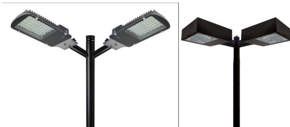
Figura 03 – Poste com luminárias LED.