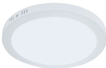
Figura 01 – Luminária de sobrepor, tipo plafon circular com LED 12/13W.