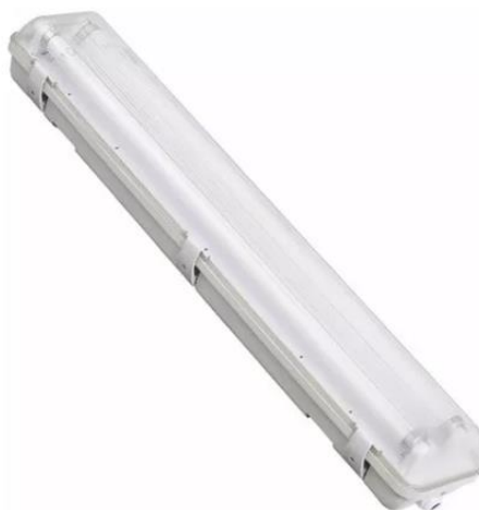
Figura 04 – Luminária hermética/blindada com duas lâmpadas LED 1,2m de 18W